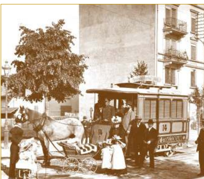
Rösslitram in Aussersihl

Die Ortsgeschichtliche Kommission setzt mit ihren Veröffentlichungen Akzente. Nach der Ausstellung „100 Jahre Stauffacher“, der Broschüre „Die Seebahn“, dem Buch „Militär im Sihlraum“ und den beiden Büchern „Die SBB unserer Grosseltern – eine Spurensuche“ ist Ende November 2017 unser neuestes Buch „Die Tram-, Bus- und Quartiergeschichte im Aussersihl“ erschienen.