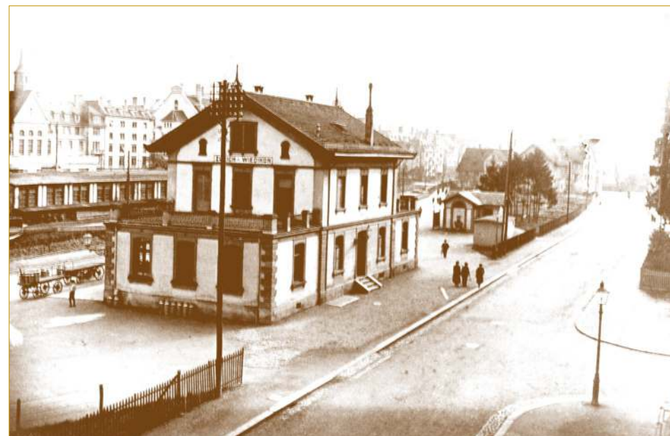
Bahnhof Aussersihl-Wiedikon - ab 1893 Bahnhof Zürich-Wiedikon